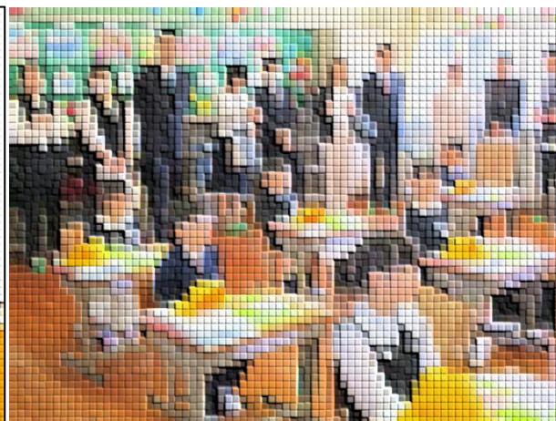
担任の先生のお話を真剣に聞いている1年生